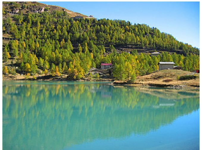
Agriturismo Alpe Palü avec le Lagh da Palü