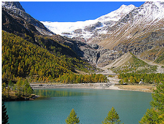
Sentiers et itinéraires

La description détaillée des excursions peut être téléchargée en format PDF en cliquant sur le parcours respectif :