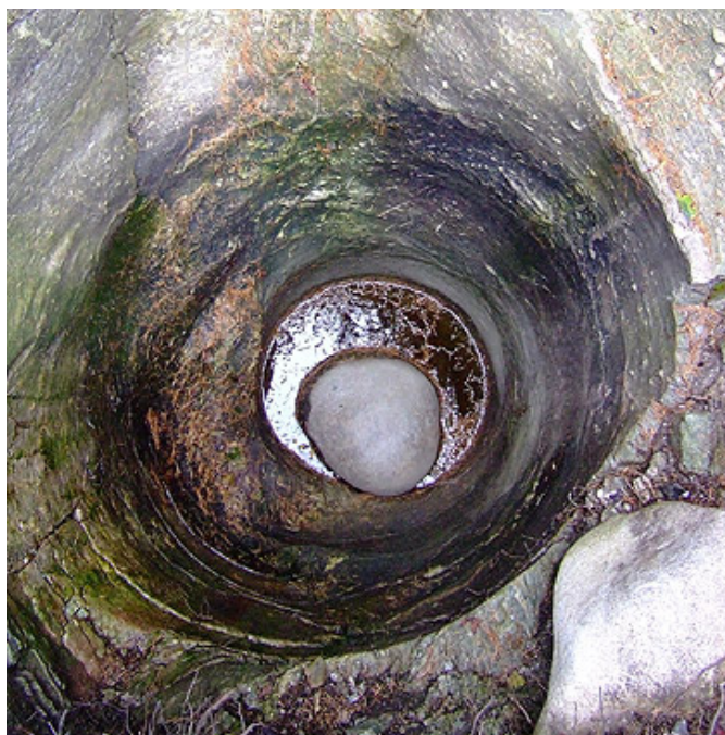
Marmite no. 12

∩ ∅ 1.950 m ↔ ∅ 1.160 m Profondeur 1 1.660 m Profondeur 2 2.860 m