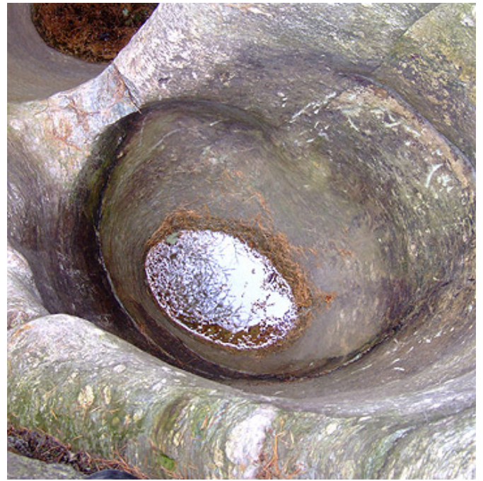
Marmite no. 11

∩ ∅ 2.250 m ↔ ∅ 1.930 m Profondeur 1 3.960 m Profondeur 2 6.060 m