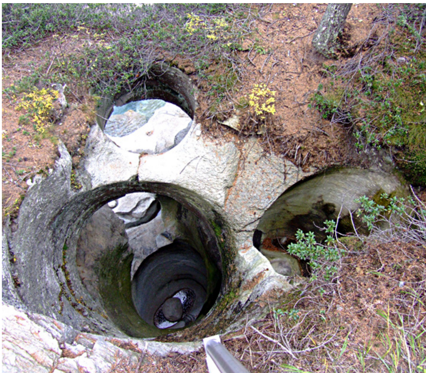
Les trois spectaculaires marmites no. 8, 9 et 10 au-dessus du tourbillon du Cavagliasco