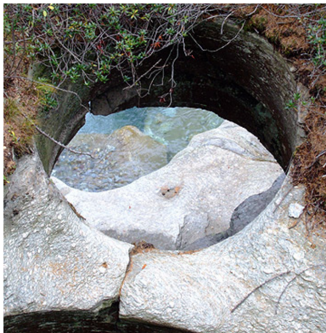
Marmite no. 10