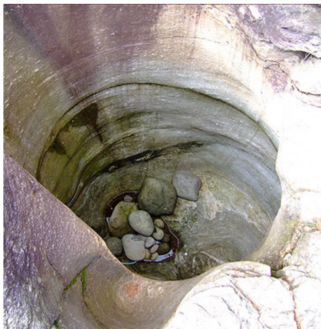
Marmite no. 01

\updownarrow \emptyset 0.340 m \longleftrightarrow \emptyset 0.340 m Profondeur 1 0.600 m Profondeur 2 1.020 m