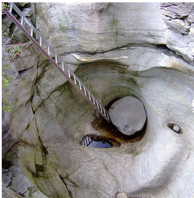
Marmite no. 02

\updownarrow \varnothing 4.066 m \longleftrightarrow \varnothing 3.760 m