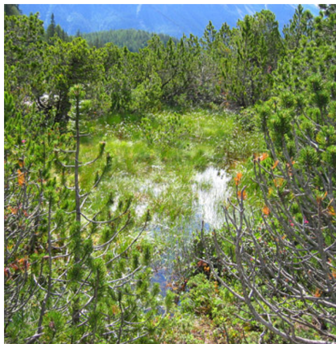
Biotope avec la typique végétation alpestre