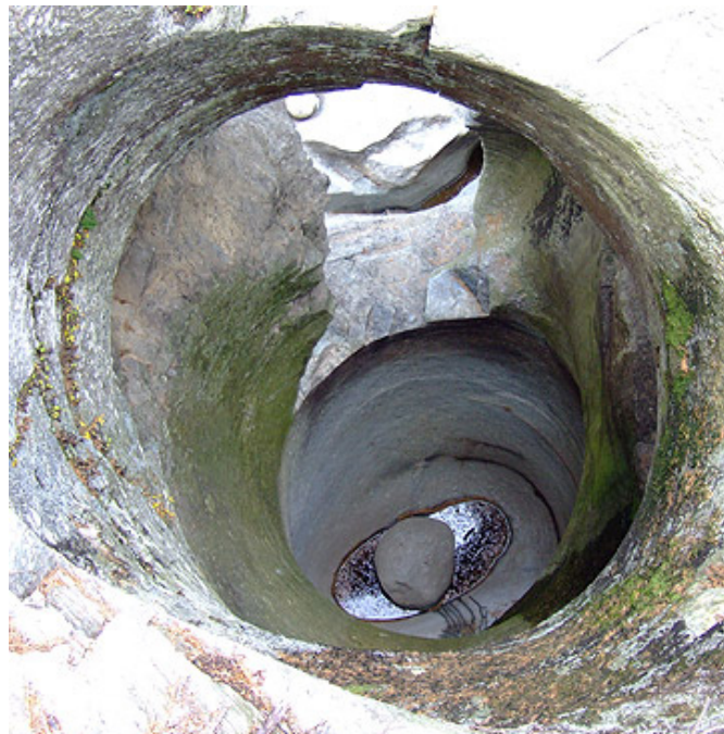
Marmite no. 09