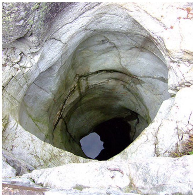
Marmite no. 06

∩ ∅ 2.900 m ↔ ∅ 2.400 m Profondeur 1 10.800 m Profondeur 2 14.100 m