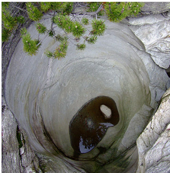
Marmite no. 05

∩ ∅ 3.500 m ↔ ∅ 3.340 m Profondeur 1 5.320 m Profondeur 2 6.720 m