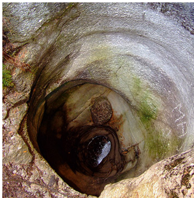
Marmite no. 13

∩ ∅ 1.950 m ↔ ∅ 1.160 m Profondeur 1 1.660 m Profondeur 2 2.860 m