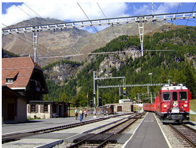
Gare de Cavaglia