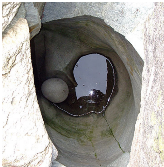
Marmite no. 05b

∩ ∅ 3.500 m ↔ ∅ 3.340 m Profondeur 1 5.320 m Profondeur 2 6.720 m