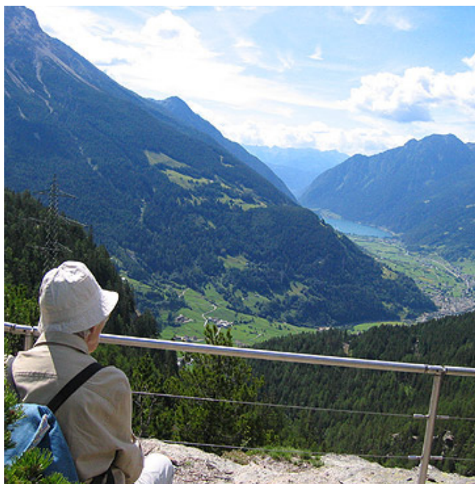
Vue panoramique sur le Val Poschiavo

∩ ∅ 3.840 m ↔ ∅ 5.230 m Profondeur 1 10.200 m Profondeur 2 11.350 m