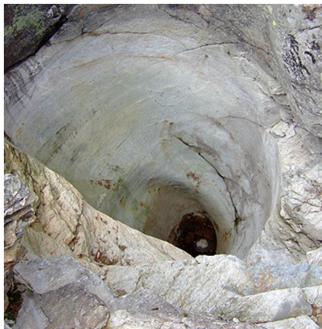
Marmite no. 07

∩ ∅ 2.900 m ↔ ∅ 2.400 m Profondeur 1 10.800 m Profondeur 2 14.100 m