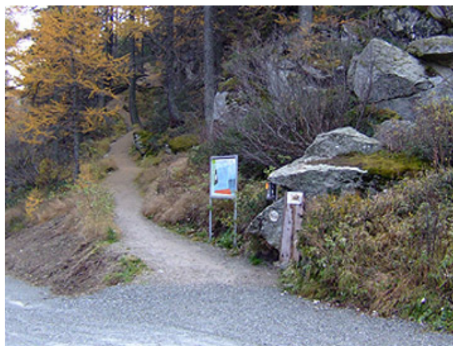
Entrée du Jardin des glaciers de Cavaglia