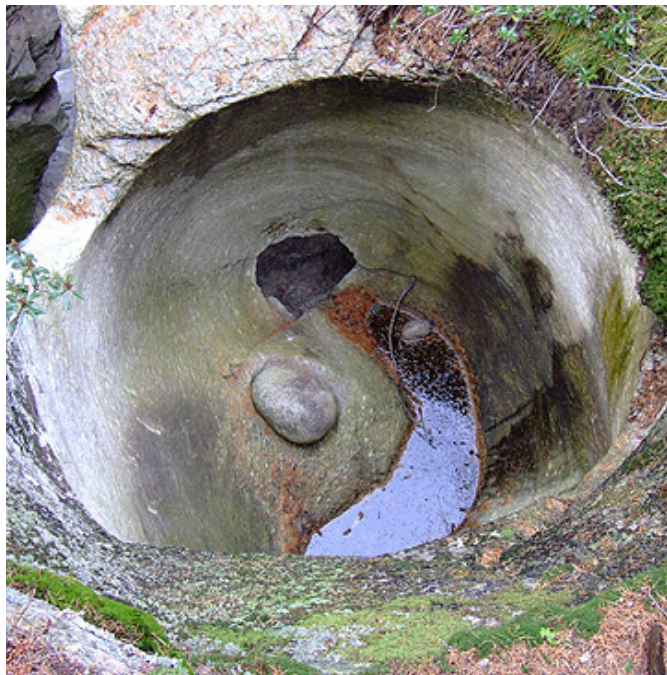
Marmite no. 08